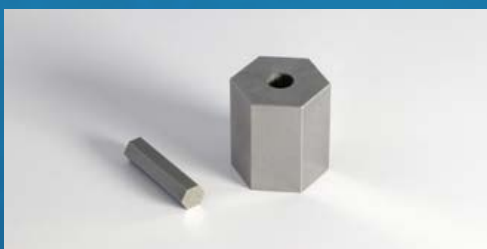
FABRICATION DE PRÉCISION