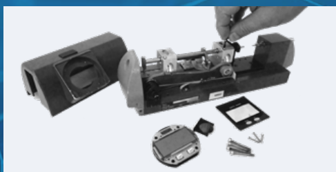
RÉPARATION - SAV - RÉVISION