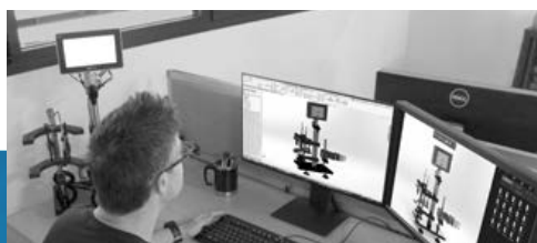
ÉTUDE & CONCEPTION MOYENS DE CONTRÔLE