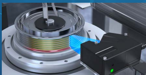
CONTRÔLES AUTOMATISÉS - ROBOTS