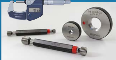
CALIBRES - INSTRUMENTS - MACHINES