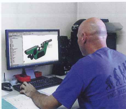
Etude & Conception Moyens de Contrôle