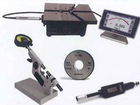
Calibres • Instruments • Machines