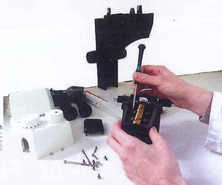
Réparation • SAV

« Nous proposons tous les appareils de mesure qui existent. Et s'ils n'existent pas, on les crée »