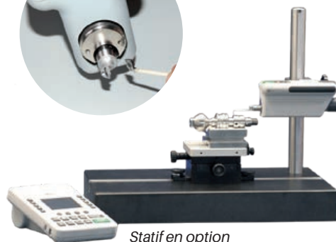
Statif en option